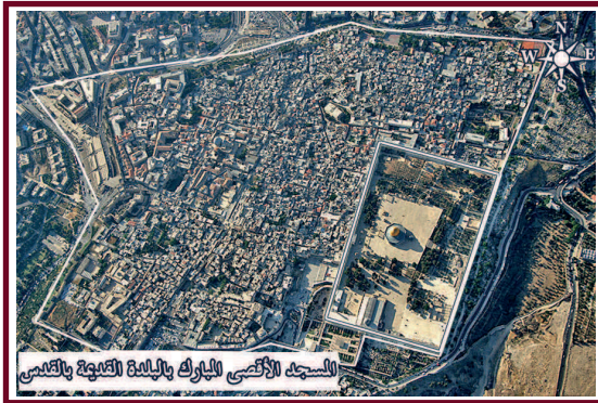
المسجد الأقصى المبارك بالبلدة القديمة بالقدس