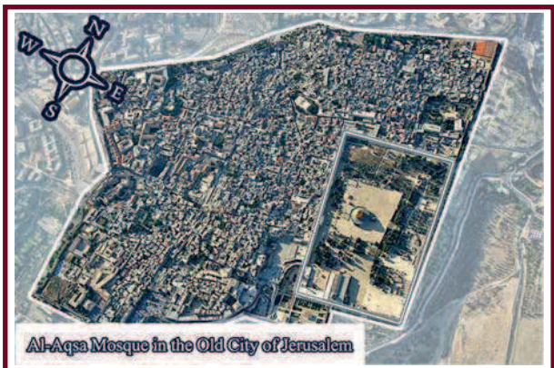
Al-Aqsa Mosque in the Old City of Jerusalem

[Attributed and considered as correct by Al- Hakem, and agreed as such by Al-thahaby]