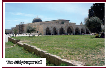
The Qibly Prayer Hall