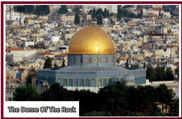
The Dome Of The Rock

Between 715-686 c /96-66 h, the Omayyads built the Dome of the Rock and reconstructed the qibly hall as well, to bring the complete compound of Al-Aqsa much to its present shape.