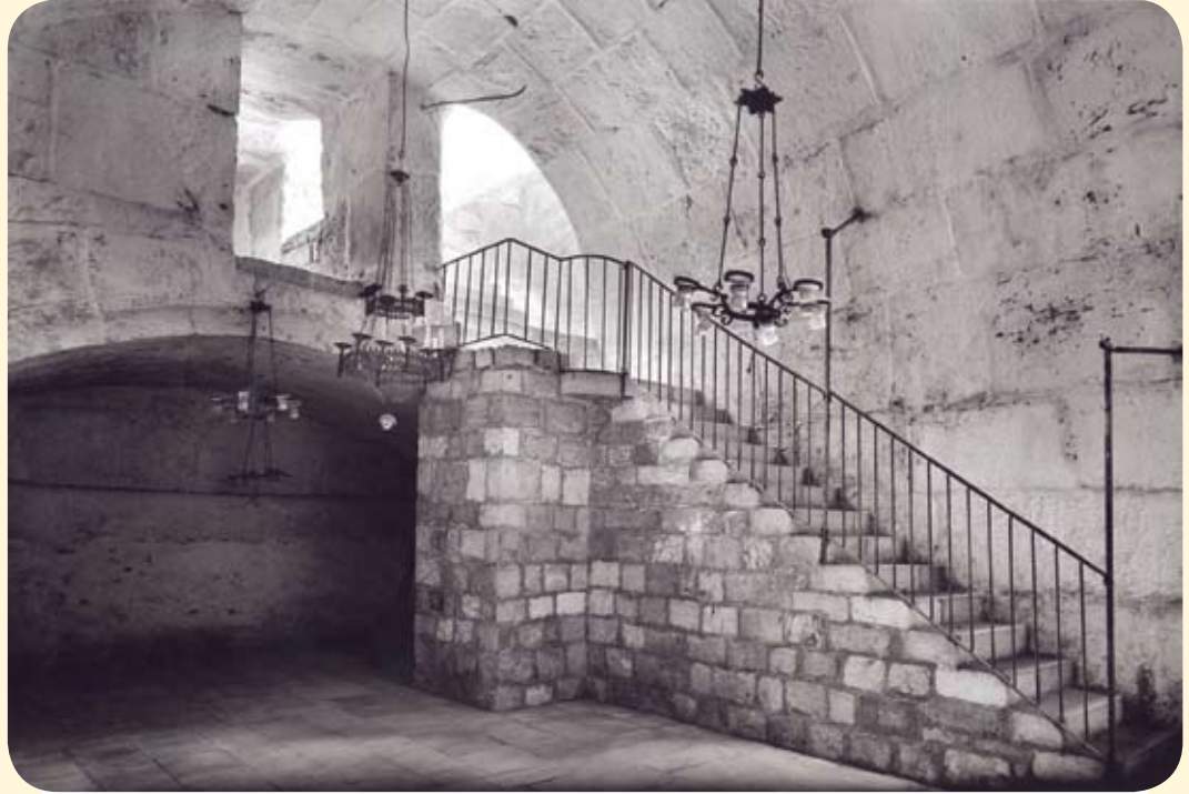
(مسجد البراق - مفتوح للصلاة يومياً).

يقع مسجد البراق تحت باب المغاربة الى الشمال بمحاذاة حائط البراق للمسجد الأقصى ، ويتألف من قبو برميلي ينزل إليه بعدد من الدرجات من الرواق الغربي داخل ساحات المسجد الأقصى ، وقد عرف باسمه بسبب وجود الحلقة التي يعتقد ان النبي محمد صلى الله عليه وسلم ربط فيها دابة البراق ليلة الإسراء والمعراج .