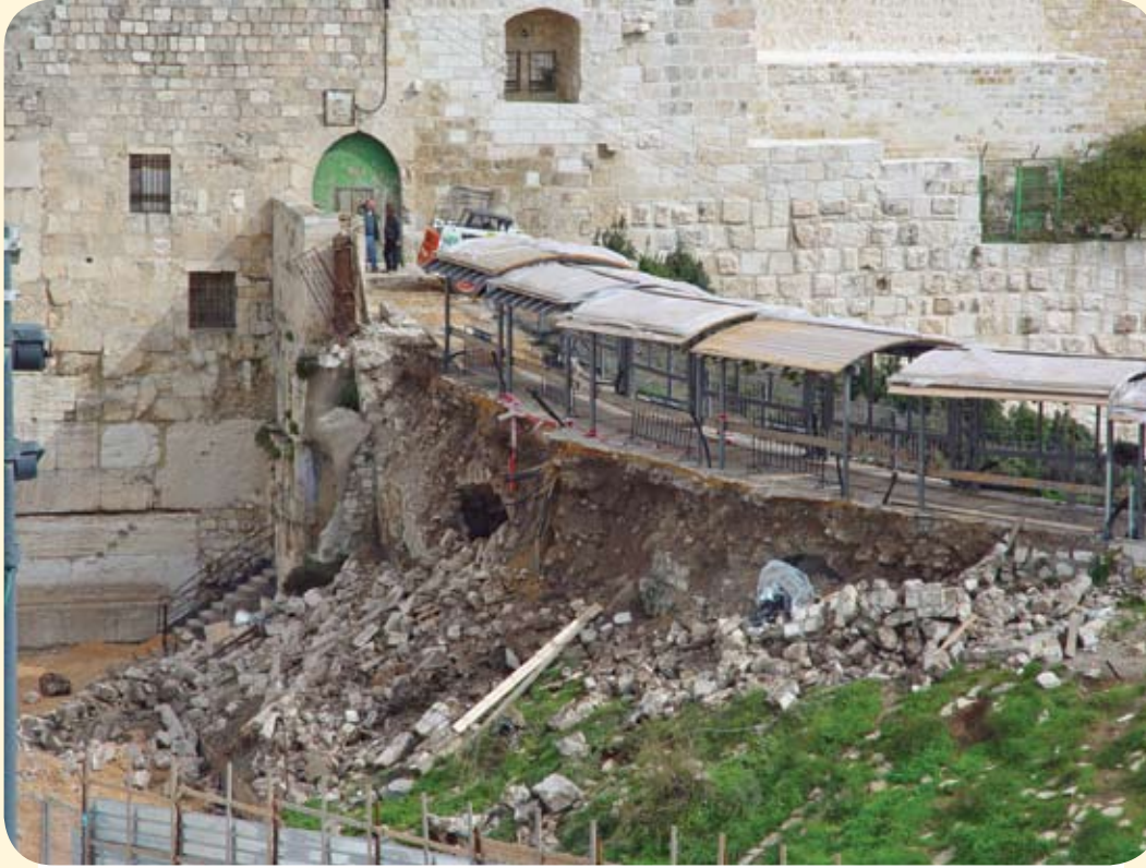
( انهيار في طريق باب المغاربة ٢٠٠٤ / ١٢ / ١٥ م تصوير اriad النائل - مؤسسة الرسالة).

(A collapse in the path leading to the Maghariba Gate in early, December 15 th , 2004. Photographed by Iyad al-Na'il - Al-Resalah Association)