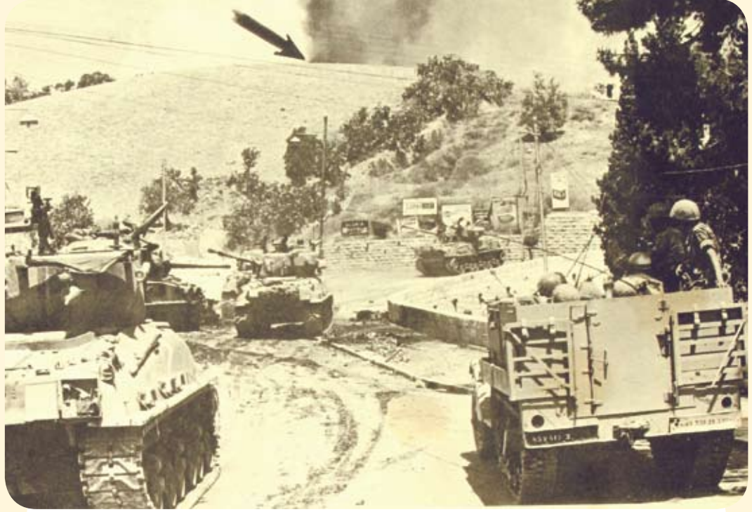
"BAQOON" - The Mughrabi Quarter Catastrophe

١٩٦٧/٦/٧م اليوم الثالث للعدوان الاسرائيلي تتقدم المجنزرات والدبابات الاسرائيلية لتحتل البلدة القديمة في القدس . وتدخل آلياتها العسكرية عن طريق باب الأسباط وهي تطلق قذائفها صوب مئذنة باب الأسباط ، ومن ثم تقتحم باب الأسباط -أحد أبواب البوابات الشرقية للقدس . والقريبة جدا للمسجد الأقصى- .