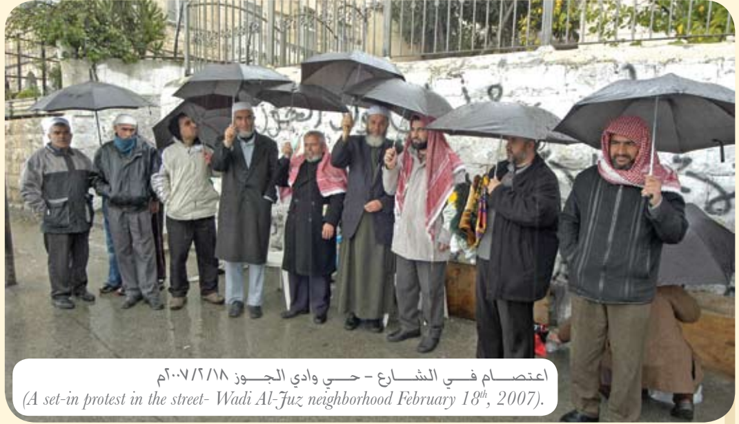
اعتصام في الشارع - حي وادي الجوز ١٨/٢/٢٠٠٧ (A set-in protest in the street- Wadi Al-Jouz neighborhood February 18 th , 2007).

أربعون عاماً هي عمر الاحتلال الإسرائيلي للمسجد الأقصى ولشرفي القدس، أربعون عاماً أُعمل فيها الأخطبوط الصهيوني يده ومكره ودهائه لتهود المكان والانسان، لتهود الحجر والبشر، وكشفت أحداث باب المغاربة أن المؤسسة الاسرائيلية خابت وانتكست وفشلت أن تبعد أهل القدس عن قضيتهم الأساس قضية المسجد الأقصى المبارك، وحاولت المؤسسة الاسرائيلية أن تضلل الرأي العام وكأن أهل القدس يضجرون من فعاليات التصدي لهدم طريق باب المغاربة، فكان الرد العملي والفعلية أقوى من كل أكاذيب المؤسسة الاسرائيلية وأبواقها الإعلامية، هنا في حي وادي الجوز على بعد ١٥٠ متراً عن المسجد الأقصى ضرب المقدسيون أروع أمثلة الالتفاف حول قضية المسجد الأقصى، هنا تفجرت مرة واحدة معادن الخير في الرجال والنساء والأطفال، معادن الخير التي ما خفيت يوماً من الأيام، ولكنها المعادن التي تبرز عند الامتحان ووقت الشدائد والمحن، هنا انطلق الاعتصام بداية بالقرب من «حسبة وادي الجوز»، انتقل بعدها الى الشارع الرئيسي في حي وادي الجوز، وتحول لأيام في ساحة بيت، وثبت أخيراً على سقف آل الحلواني، هنا في حي وادي الجوز لسان الحال والمقال يردد كل صباح ومساءً «كلنا للأقصى حماة»، وأوضحى الحي قلعة المرابطين دفاعاً عن المسجد الأقصى المبارك.