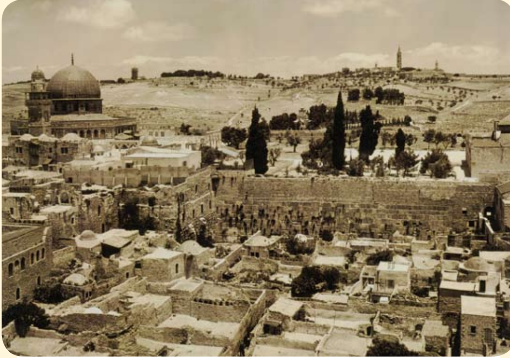
(حي المغاربة عام ١٩٣٠م - تصوير إيليا كهوجيان).

(The Maghariba Quarter in 1930. Photographed by Iliya Kahwajian)